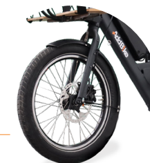
Roues épaisses et résistantes pour une meilleure adhérence