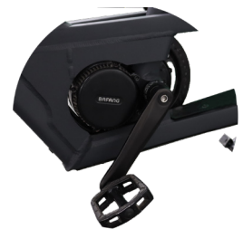
Bafang BBS01 - Moteur pédalier 80Nm / 250W