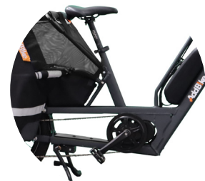
Emplacement pour une seconde batterie