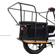
Protech'360 Armature métallique résistante pour une protection totale (des pieds aux mains)