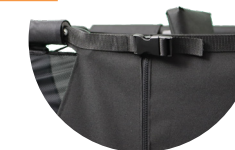
Porte latérale (côté trottoir)