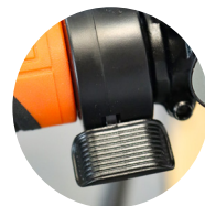
Easy-Start Pas besoin de pédaler pour démarrer ! Utilisez la gâchette