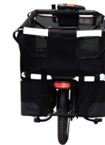
Dispositifs réfléchissants intégrés Éléments réfléchissants de tous les côtés et un feu frontal puissant