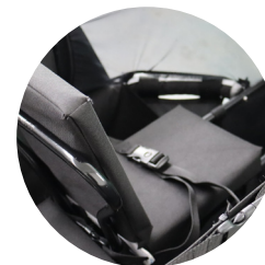
Ceintures intégrées Le dossier peut être retiré Rack compatible avec les sièges enfants