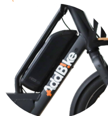
Batterie 14.5Ah/ 36V/ 522 Wh